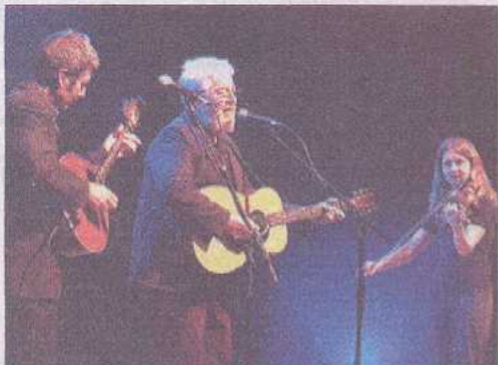
Le trio Dirty Linen a été salué debout par un public enthousiaste.

Il est 17 h 45 très précises lorsque la petite Mathilde déclare, d'une voix tremblotante, que la dixième édition des Traversées de Tatihou est ouverte. Le grand chapiteau installé spécialement sur l'île de Tatihou est déjà plein comme un parc à huîtres à quelques semaines des fêtes de fin d'année.