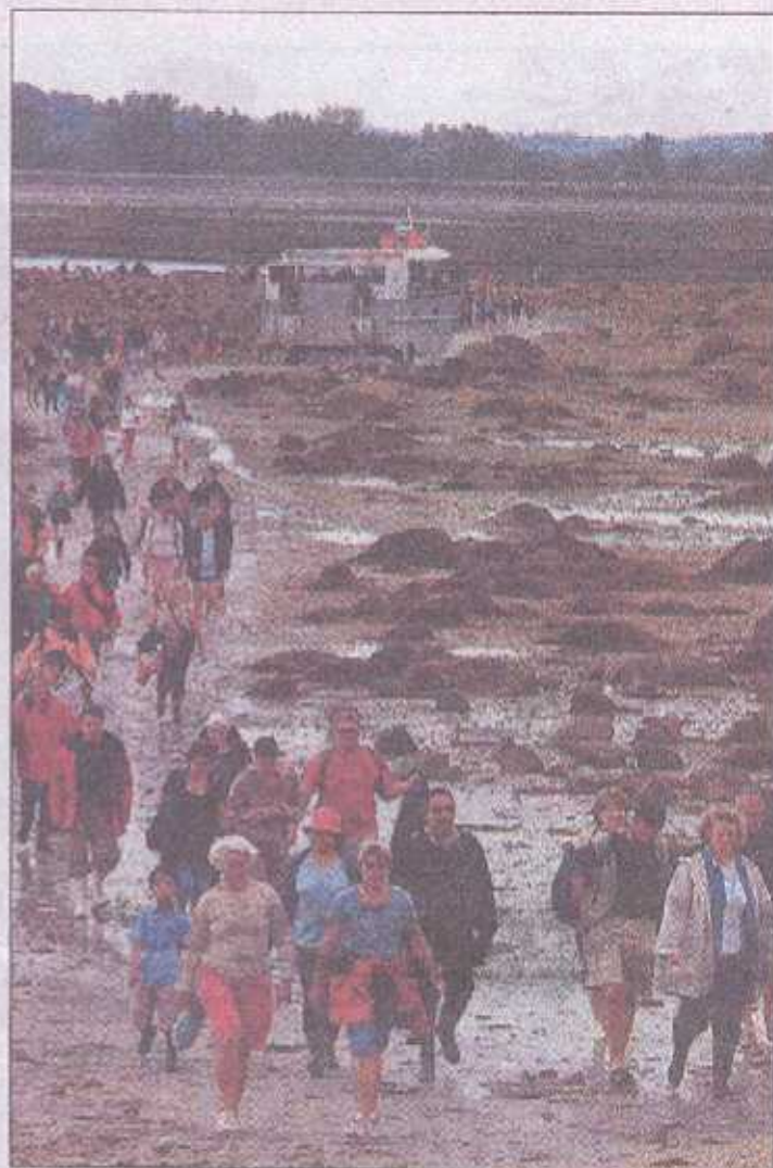
La magie des Traversées de Tatihou réside notamment dans la demi-heure de marche entre Saint-Vaast et l'île.